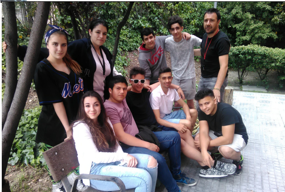
El grupo de diversificación y PMAR en la gala de premios de la Comunidad de Madrid