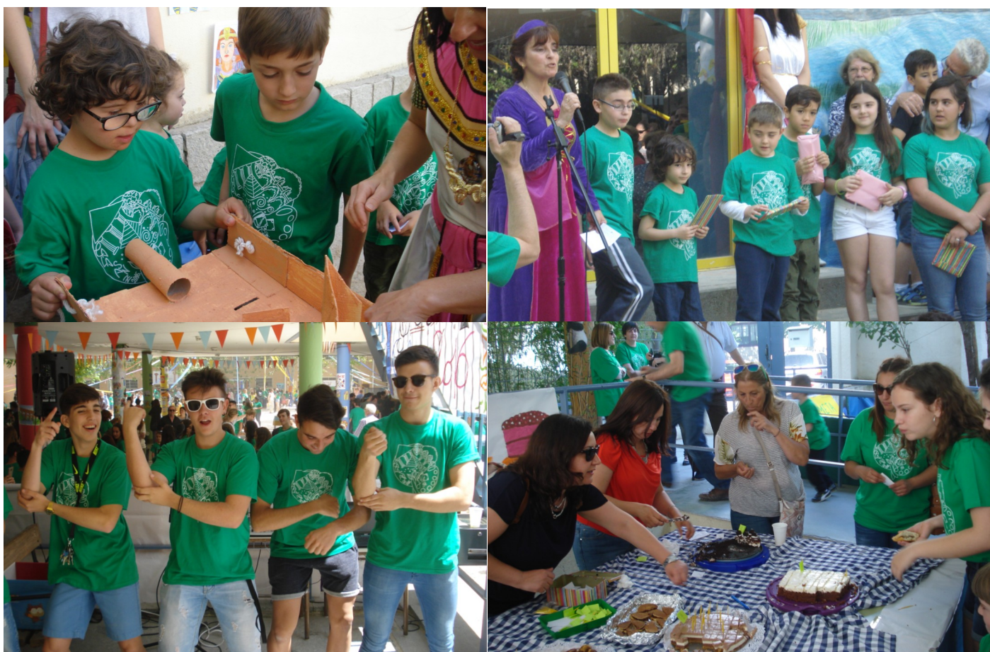
Distintos momentos de la “Fiesta del Arte” el pasado día 27 de junio de 2016.

profundizado sobre ella realizando diferentes actividades: visitas a museos, decoración de la clase, trabajos, presentaciones, manualidades, obras de teatro,... Una parte de lo trabajado se ha enseñado en la exposición del gimnasio el día de la fiesta. Los/as alumnos/as durante esa semana y la siguiente han ido explicando a otras clases todo lo que han aprendido, transmitiendo los conocimientos adquiridos al resto de compañeros. Lo más importante de ser un “experto” en alguna materia es que lo podemos compartir y transmitir a los demás. El día de la fiesta es un día muy importante en la vida del colegio, por medio de la participación de toda la comunidad educativa: padres, madres, alumnos/as, profesores/as conseguimos pasar un día de convivencia todos juntos disfrutando de los juegos, los puestos de comida, el baile,... como colofón del trabajo realizado durante todo el curso. El arte es la magia de transmitir la emoción.