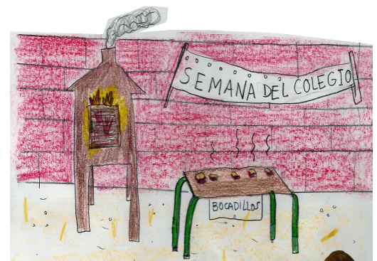
Ilustración de Josué Serrano, 4º Primaria